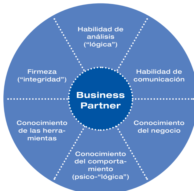
Figura 4: Competencias básicas de los Controllers