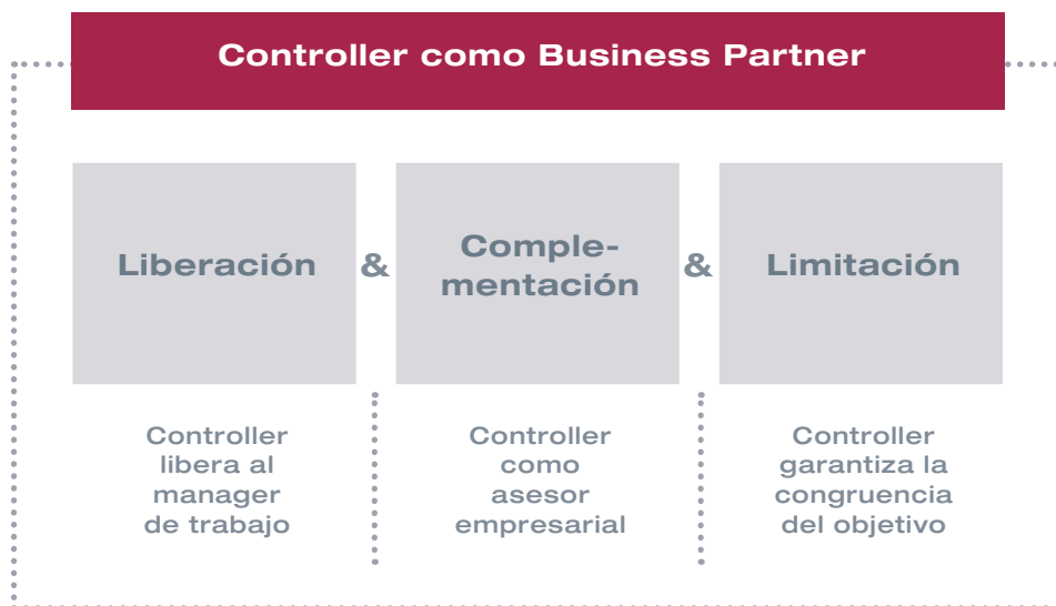
Figura 3: Apoyo directivo mediante el Controller según Weber / Schäffer

El trabajo conjunto entre el manager y el controller, en su sentido de Business Partner, debe efectuarse al mismo nivel. Sin duda, los managers marcan las pautas, pero los controllers son a día de hoy corresponsables para el logro de los objetivos de la empresa, por lo que no deben esperar de forma pasiva a las órdenes del manager, sino que deben actuar de forma proactiva, complementando al partner en la gestión . Esto rige tanto para operaciones diarias como para desarrollos de base, por ejemplo en la fijación hacia la orientación en la generación de valor o en la sostenibilidad empresarial de la dirección. Identificar e impulsar estos temas es la faceta central del rol de un Business Partner. Durante este proceso han adquirido bastante importancia los malabarismos que tienen que realizar los Controllers entre colaboración activa en el proceso directivo, aportando ideas propias y salvaguardando los intereses de la empresa, y por otro lado actuando de forma crítica como sparring (“Involvement versus independence”) . Los Controllers tienen que tener la capacidad de manejar ambas cuestiones.